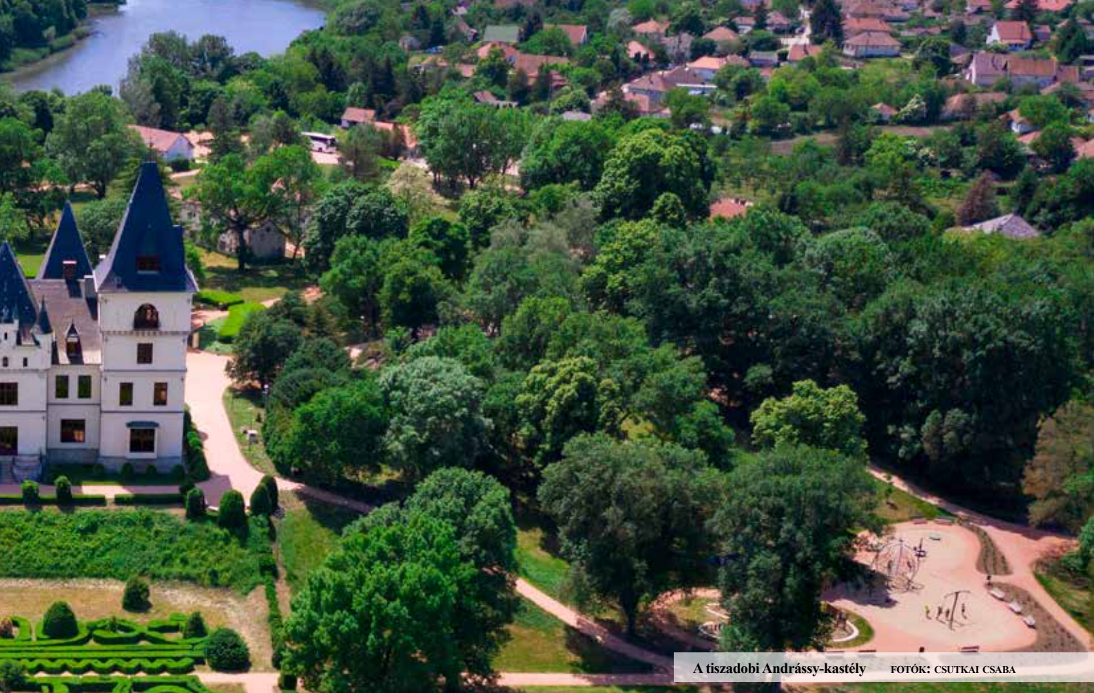
A tiszadobi Andrassy-kastély