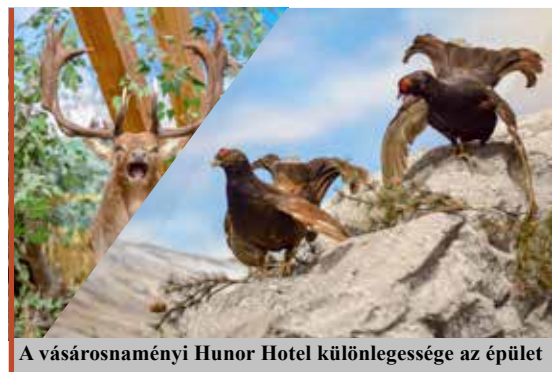
A vásárosnaményi Hunor Hotel különlegessége az épület