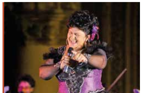
Minden alkalommal fergeteges hangulatot teremt