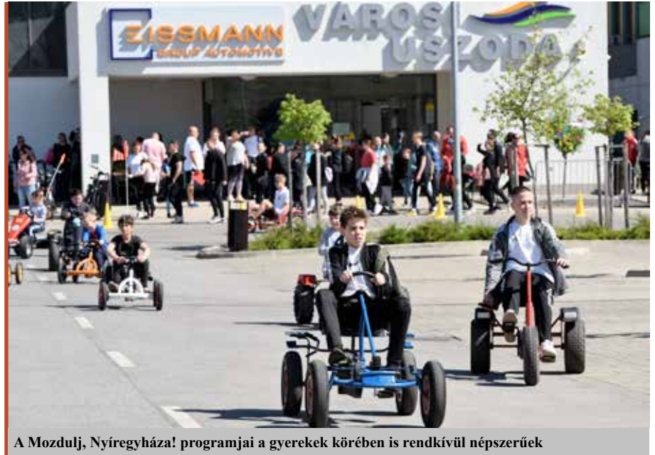
A Mozdulj, Nyíregyháza! programjai a gyerekek körében is rendkívül népszerűek

– Mit tesz a városvezetés annak érdekében,