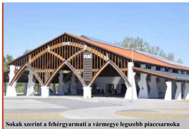
Sokak szerint a fehérgyarmati a vármegye legszebb piaccsarnoka

Jó néhány elnyert pályázatunk van a TOP Plusz keretében, de megvalósítás alatt van a zöld város közterületfejlesztési program is,