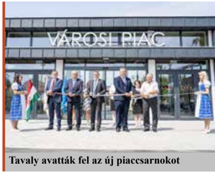
Tavaly avatták fel az új piaccsarnokot

A város közel 70 kilométernyi belterületi úthálózatának jelentős hányada nem szilárd burkolatú, de a többiek jórésze is felújításra szorul. Folyamatosan figyeljük a pályázati lehetőségeket, ugyanis saját forrásból évente csak 2-3 kilométernyi útszakasz felújítását tudjuk finanszírozni. A kommunális adóbevételt, melynek mértéke 35 millió forint körül mozog, kizárólag útépitésre fordítjuk.