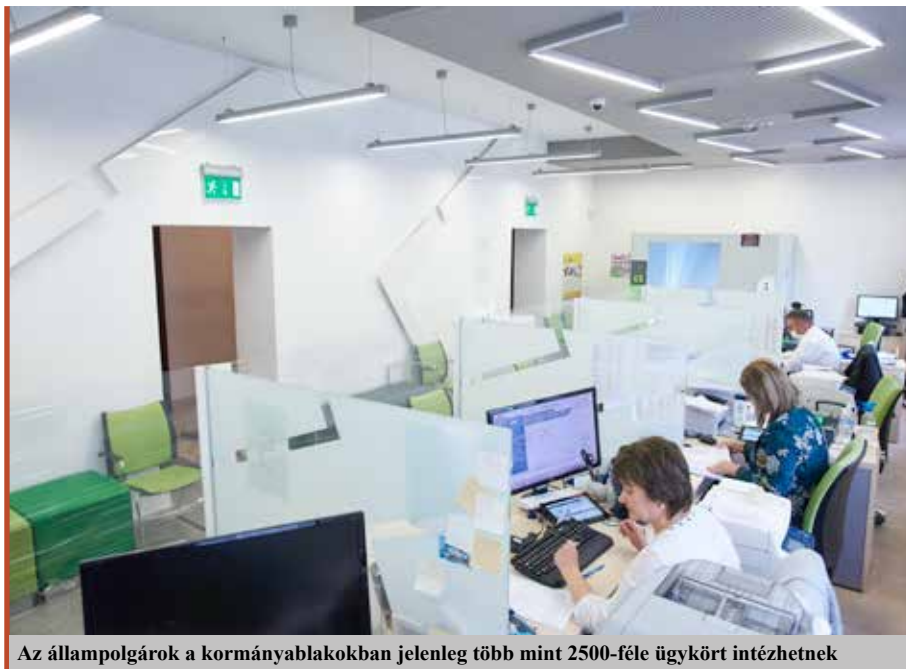
Az állampolgárok a kormányablakokban jelenleg több mint 2500-féle ügykört intézhetnek

– Az elmúlt években több nagyberuházás érkezett a vármegyébe, mérőföldkőnek számító fejlesztéseken vagyunk túl, bővült a gyártókapacitás, új utak épültek, az élelmiszer-feldolgozás csúcsokat dönt. Bővült a foglalkoztatás, felértünk Európa logisztikai térképére. S hogy