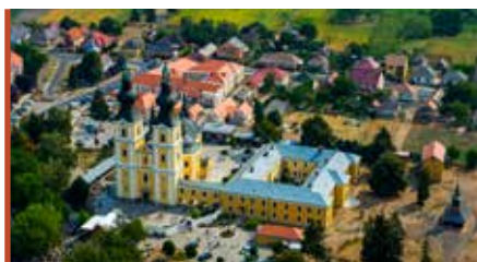
A görögkatolikus templom

– Több száz milliós beruházások valósultak meg, az úthálózat jelentős részét felújítottuk, kerékpárút-hálózat épült. Biciklivel biztonságos módon lehet közlekedni a település teljes belterületén, illetve a külterületeken is. Kerékpárutas összeköttetésben vagyunk más településekkel, például Nyírbogáttal, és most építjük a Kállósején–Máriapócs közötti kerékpárutat. Nyírgyulaj felé pedig szélesítjük a már meglévő utat. Előttünk álló feladat még a belső úthálózat rendbetétele. Pályázhatunk a Magyar Falu Programban, ám döntenünk kell, hogy melyik utat csináltatnánk meg. A temetőt, a ravatalozót rendbe tudtuk hozni, mindkét temető kaphatott kerítést. A korábban elnyert pályázati összegeknek köszönhetően a középületeket fel tudtuk újítani, mindegyikre napelem került, és hőszivattyús