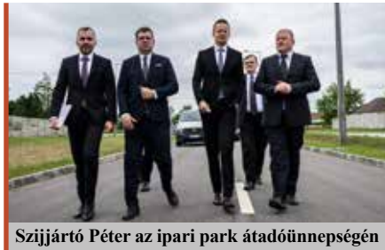
Sziijártó Péter az ipari park átadónál.

– 23 éve vezetem a települést, képviselőtársaimmal együtt a kezdetektől kiemelten fontos célként kezeljük a munkahelyteremtést, mert elengedhetetlenül szükséges a város gazdaságának fejlesztéséhez. Ennek alapja a jelenleg közel 100 ha térmértékű iparterület, és annak alpinfrastruktúrával való ellátása, amely a TOP-1.1.1-16-SB1-2017-00006. projekt keretében részben megvalósulhatott. Köztudott, hogy a keleti országrészben az önkormányzatok nehéz helyzetben vannak, a legtöbb településen alacsony a helyi adóbevétel. Kemecsen a szociális, illetve az oktatási-nevelési intézmények a helyi református egyház fenntartásában vannak, csök-