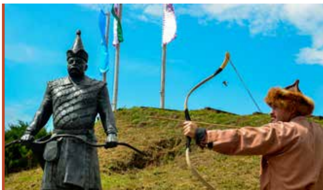
A hagyományörzésnek fontos szerepe van a vármegyében

Az interjú teljes szövege a www.pannoniakincsei.hu -n olvasható.