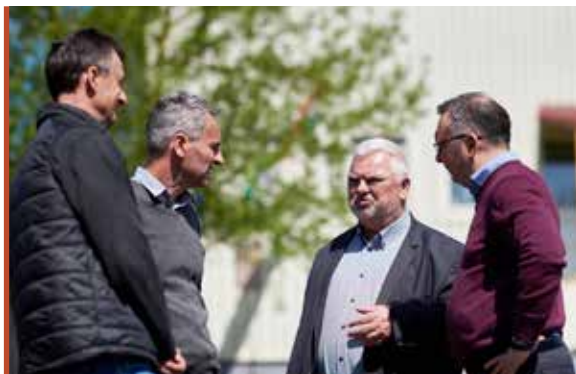
Határszemen a Kormányhivatal munkatársai Záhonyban

Az interjú teljes szövege a www.pannoniakincsei.hu -n olvasható.