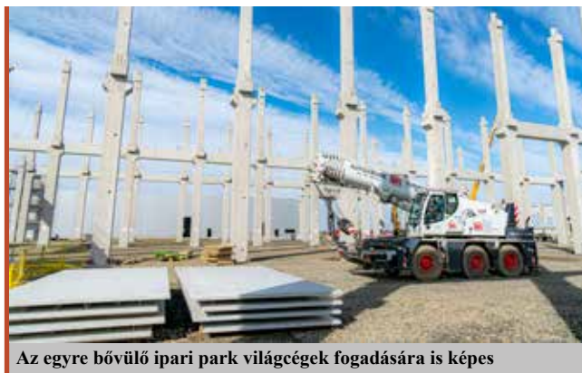
Az egyre bővülő ipari park világcégek fogadására is képes

– A címet idén márciusban nyertük el, és azok kaphatták meg, akik mérhető megtakarításokkal vagy mérhető megújuló energiatermeléssel rendelkeznek. Nyíregyháza Megyei Jogú Város Önkormányzata az energetikai beruházások vonatkozásában pedig számos fejlesztést és felújítást hajtott végre az önkormányzati tulajdonú, önkormányzati fenntartású közintézményekben, intézményekben. 2010-től napjainkig 11 komplex energetikai pályázat nyert támogatást, valamint 15 egyéb energetikai megtakarítást eredményező pályázat került megvalósításra. A 26 pályázatban összesen 86 ingatlan – óvodák, bölcsődék, iskolák, kulturális intézmények, szociális intézmények stb. – esetében történt energetikai fejlesztés, korszerűsítés. Ezen pályázatok keretében 21 egyéb nem önkormányzati tulajdonú ingatlan, pl. lakótelepi toronyházak is energetikai felújításon estek át. Mindezekon felül pedig 35 intézményre került napelen. A fogyasztási adatokat megvizsgálva megállapítható, hogy szinte minden esetben fokozatosan csökkent az energiafelhasználás, átlagosan 10–30% közötti megtakarítást értek el az intézményeink. ■