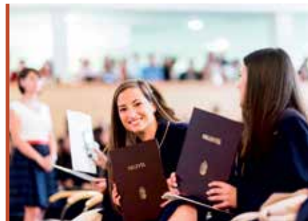
Cél a versenyképes diploma megszerzése