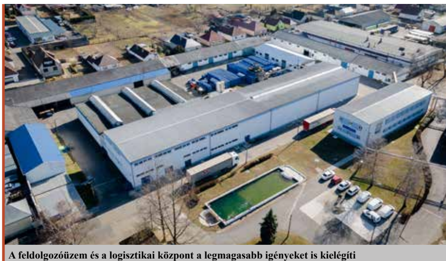
A feldolgozóüzem és a logisztikai központ a legmagasabb igényeket is kielégíti

– Sorra nyerik az elismeréseket a hazai és a nemzetközi versenyeken. Minek köszönhető ez a hatalmas siker?