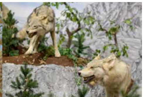
tetőterében kialakított állandó vadászati kiállítás, mely interaktív módon, hang- és képanyagok segítségével mutatja be négy kontinens vadásztrófeáit