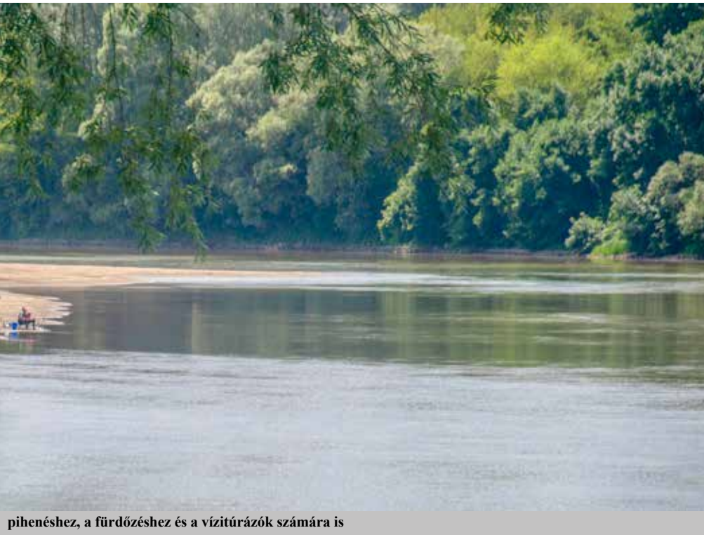
pihenéshez, a fürdőzéshez és a vízitúrázók számára is

s valóban a térség központja vagyunk, számos területen erő sugárzunk a környék települései számára. Az itt élők nyíltak és őszinték egymással, kertelés nélkül beszélnek a problémákról, de persze büszkéek az eredményeinkre is.