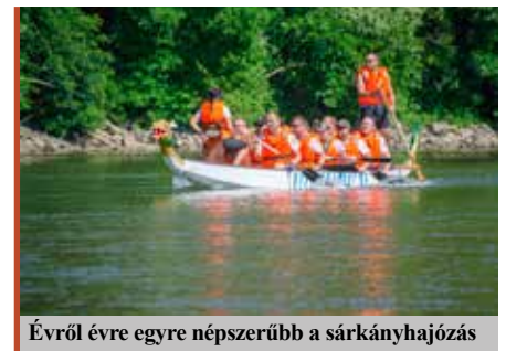
Évről évre egyre népszerűbb a sárkányhajózás

Az interjú teljes szövege a www.pannoniakincsei.hu-n olvasható.