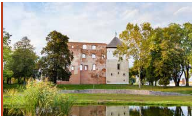
A 15. században épült vár a település egyik kulturális központja

– Iskolavárosi jellegünket számos oktatási intézményünk és kiváló pedagógusaink garantálják évtizedek óta. A történelmi egyházak mindegyike, mára már a bölcsődétől a középiskoláig biztosítja a nevelést, oktatást, s ez felekezetenként 4-4 intézményt jelent. Mellettük működik 5 önkormányzati óvodánk, egy bölcsődénk, továbbá három állami fenntartású általános iskola, egy gimnázium és egy szakközépiskola. Mindezek mellett a Debreceni Egyetemnek, az Óbudai Egyetemnek és a Nyíregyházi Egyetemnek is működik kihelyezett tagozata Kisvárdán. A felsorolt tanintézmények egytől egyig segítik diákjainkat abban, hogy a városban induljanak el választott útjukon. Több éve működik az „Esély, otthon” pályázatunk által biztosított lakhatási támogatás, mely nagy segítség a pályakezdő fiatalok számára. A projekt keretében otthont nyújtunk a tehetséges és hiányszakmákban dolgozó fiataljainknak. Kisvárdai – iskolavárosként – elsődleges céljának a társadalmi lemorzsolódás,