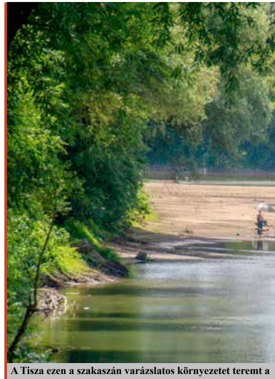
A Tisza ezen a szakaszán varázslatos környezetet teremt a