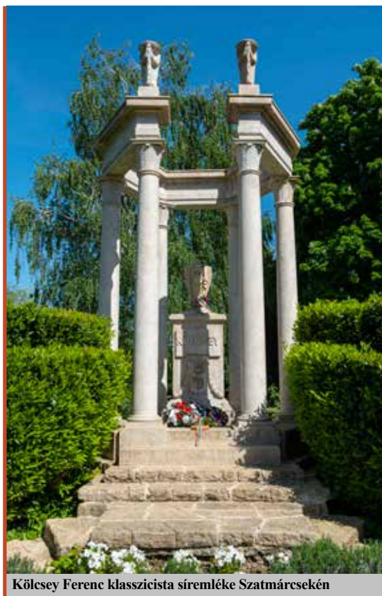
Kölcsey Ferenc klasszicista síremléke Szatmárcsékén

– A háború kitörésekor megmozdultak a határmenti települések, a közösségek egy emberként segítettek a menekülteket, nem volt szükség felhívásokra. Aztán bekapcsolódtak az önkormányzatok, segítségnyújtó szervezetek. Hatalmas szolidaritást tapasztaltam. Felemelő volt! Nem a mi felelősségünk, feladatunk a menekültellátás, de amit tudunk, megtettük: segítőtünk pénzadománnyal, szervezéssel. A Tisza Európai Területi Társulásunk például, amely hat éve alakult, nem ezzel a céllal ugyan, de kivette részét ebből a munkából.