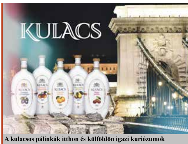
A kulacosos pálinkák itthon és külföldön igazi kuriózumok

– Büszkén vállaljuk a Kisvárdához fűződő több mint százéves kötődésünket. Ezért lehetőségeink szerint első-