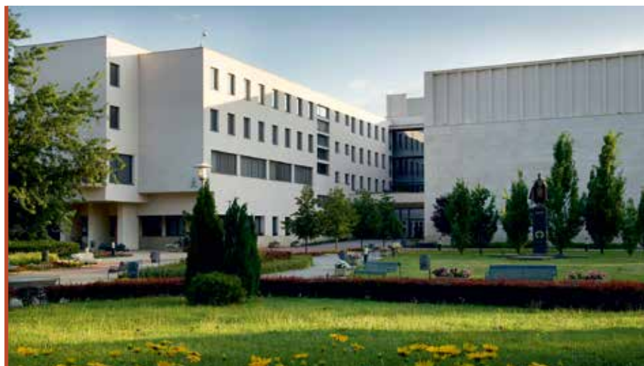
A campus elnyerte a világ legjobb középületének járó díját a Prix d'Excellence pályázatán

járvány, a háborús helyzet, a gazdasági környezet hirtelen változása megnehezítette napi működésünket. A fűtési időszak racionalizált nyitva tartásával több százmillió forint megtakarítást tudott elérni az intézmény, köszönhetően a működésünket biztosító kancellária előrelátó intézkedéseinek.