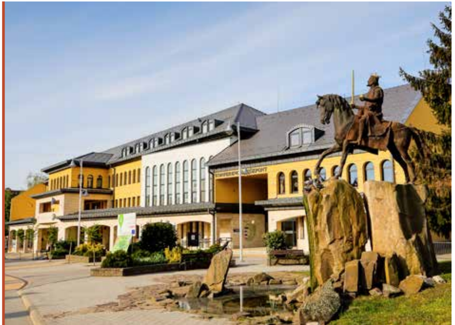
Szent László király lovasszobra Kisvárdai főterén, mögötte a Városháza épülete

leszakadás megakadályozását, a fiatalok megtartását és a tehetséggondozást tekinti.