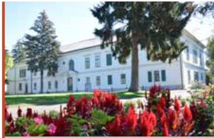
A Dégenfeld Kastélymúzeum várja vendégeit

– A közelmúltban milyen beruházások valósultak meg a járási székhelyen?