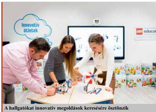
A hallgatókat innovatív megoldások keresésére ösztönzik

– A szűkös források ellenére számos intézményi, kiválósági, szociális ösztöndíjjal, valamint egyéb tanulást támogató ösztöndíjjal segítjük a hallgatókat. Nagy kihívás reményt adni a tér-