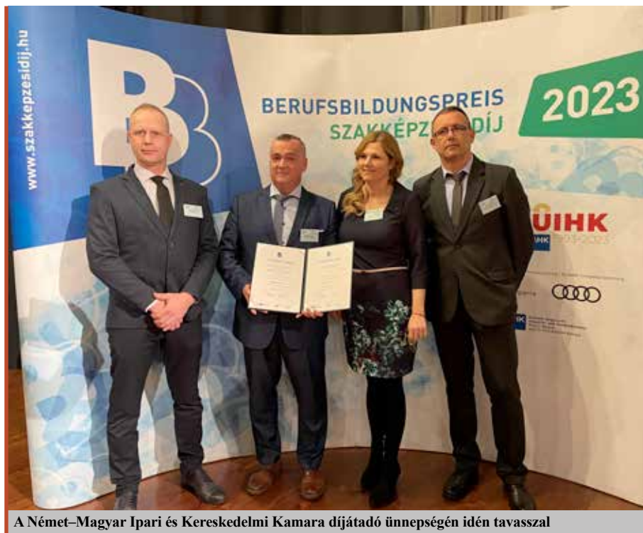
A Német-Magyar Ipari és Kereskedelmi Kamara díjátadó ünnepségén idén tavasszal

– Kiemelten fontosnak tartjuk, hogy a vállalkozások képviseletét a világ és a gazdaság gyorsan változó kihívásaihoz alkalmazkodva tegyünk. Elsősorban hasznos, gyakorlatban is alkalmazható versenyképes tudással és fontos