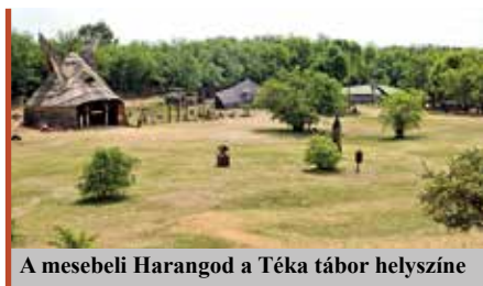
A mesebeli Harangod a Téka tábor helyszíne

– Ahogyan a vármegye, úgy Nagykálló is kiemelkedő kulturális kincset mondhat magának, gazdag, ma is értékkel bíró hagyományokkal. Elsőnek természetesen a világhírű kállai kettőst, Nagykállónak a 17. században megalkotott és négyszáz éven át megtartott, mindmáig élő, énekelt-táncolt hagyományát, illetve az ugyanzena néven ismert hímezsmotívumokat kell