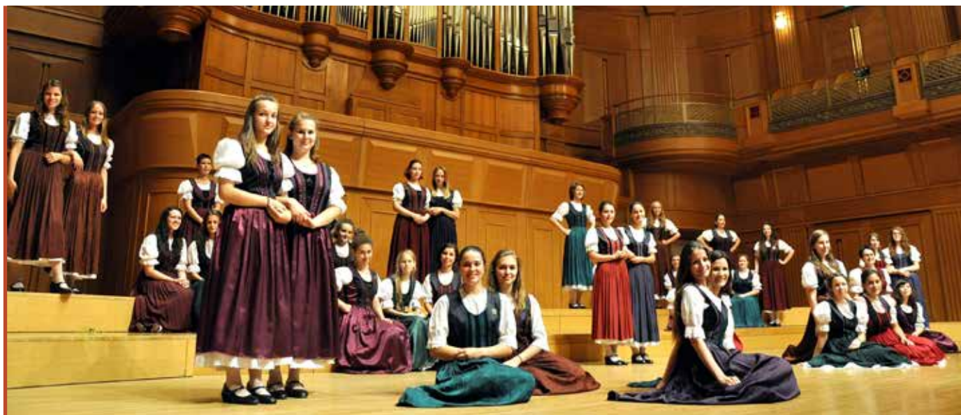
A Cantemus kóruscsalád Pro Musica leánykara távol-keleti koncertkörútja során Japánban is fellépett