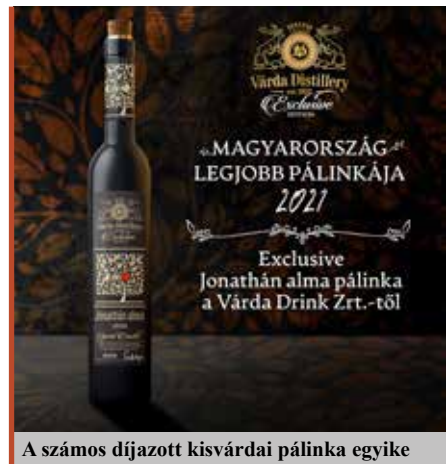
A számos díjazott kisvárdai pálinka egyike

– A mai elvárások ezt megkövetelik, kiváltképp, ha olyan érzékeny árucikkek vannak a kínálatunkban, mint például a szeszipari termékek. Ezért fontos, hogy képesek legyünk szelektív módon megszólítani a felnőttkorú fogyasztói rétegeket a kulturált italfogyasztás érdekében. Ehhez pedig szükség van sokrétű termékínálatra, nem csupán a saját üzemeinkből, hanem a világ különböző pontjairól is, például, ha autentikus rumot vagy whiskyt kínálunk a vásárlóinknak. De kiemelném, hogy a saját készítésű pálinkáink, szeszesitalaink mellett az ásványvíztől kezdve az üdítőkön, tonikokon, sörökön keresztül egészen az ételecetig nagyon bő a kínálatunk. Ez annak is köszönhető, hogy egy erős közép-európai cégcsoport, a St. Nicolaus-csoport tagjai vagyunk, és hatékonyan használjuk a szinergiák kedvező hatását.